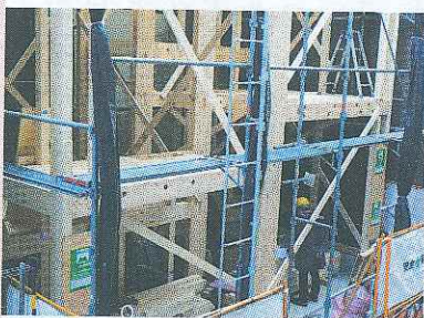
東京・銀座に建築された木造2階建て飲食店の1、2階にフロッキン狭小壁が採用された

2019年11月に東京・銀座に建築された木造2階建て飲食店の1、2階にフロッキン狭小壁が採用された