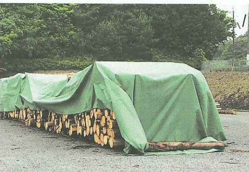
製材用丸太の劣化防止にも生かせる

大きな違いは通気性と耐久性で、雨水はシート内部を伝って排水するほか、水蒸気は逃がす構造になっている。