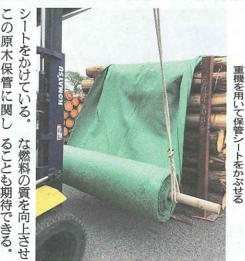
重機を用いて保管シートをかぶせる

大きな違いは通気性と耐久性で、雨水はシート内部を伝って排水するほか、水蒸気は逃がす構造になっている。